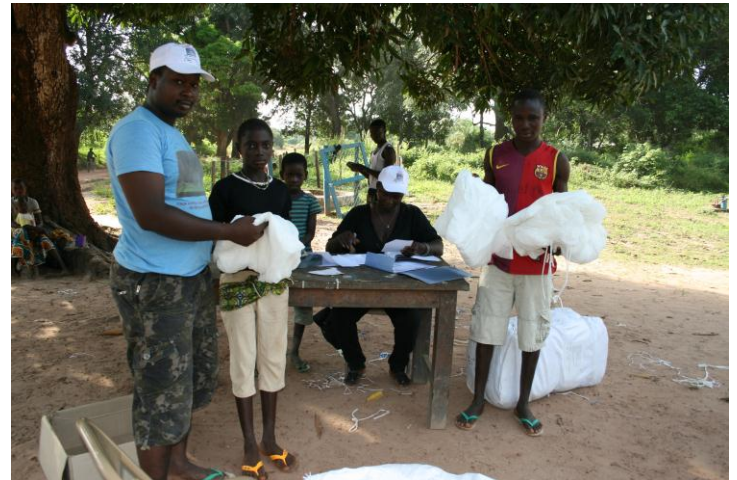
Impregnerade myggnät delas ut till alla i hela landet!