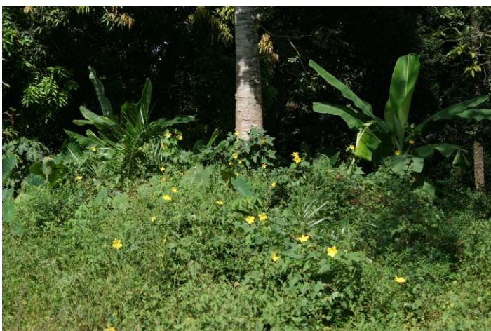
Allt är otroligt grönt nu i slutet av regnperioden.