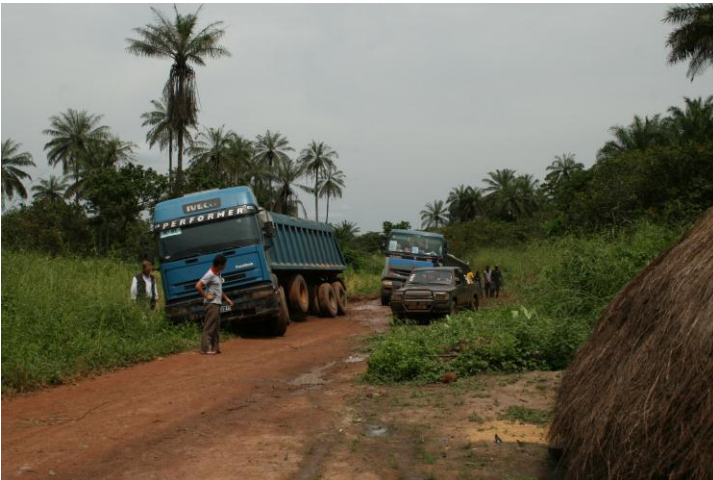
Vägstandard efter regnperioden.