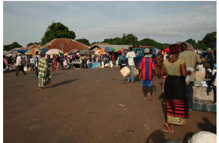
Marknad på vägen till Cacine