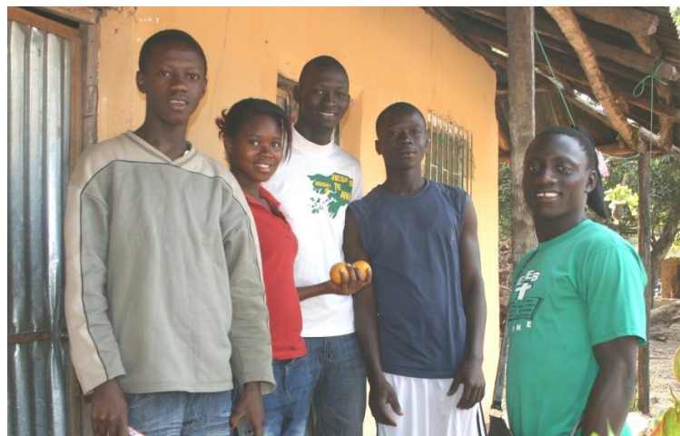
Sana i mitten tillsammans med några kompisar